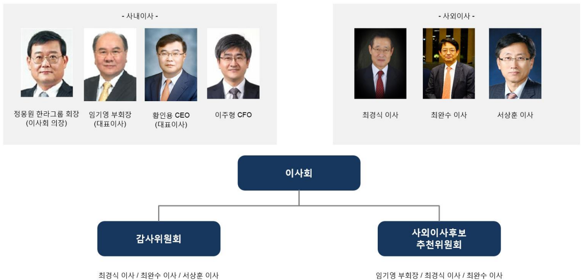
<그림2. 이사회 및 위원회 구성>